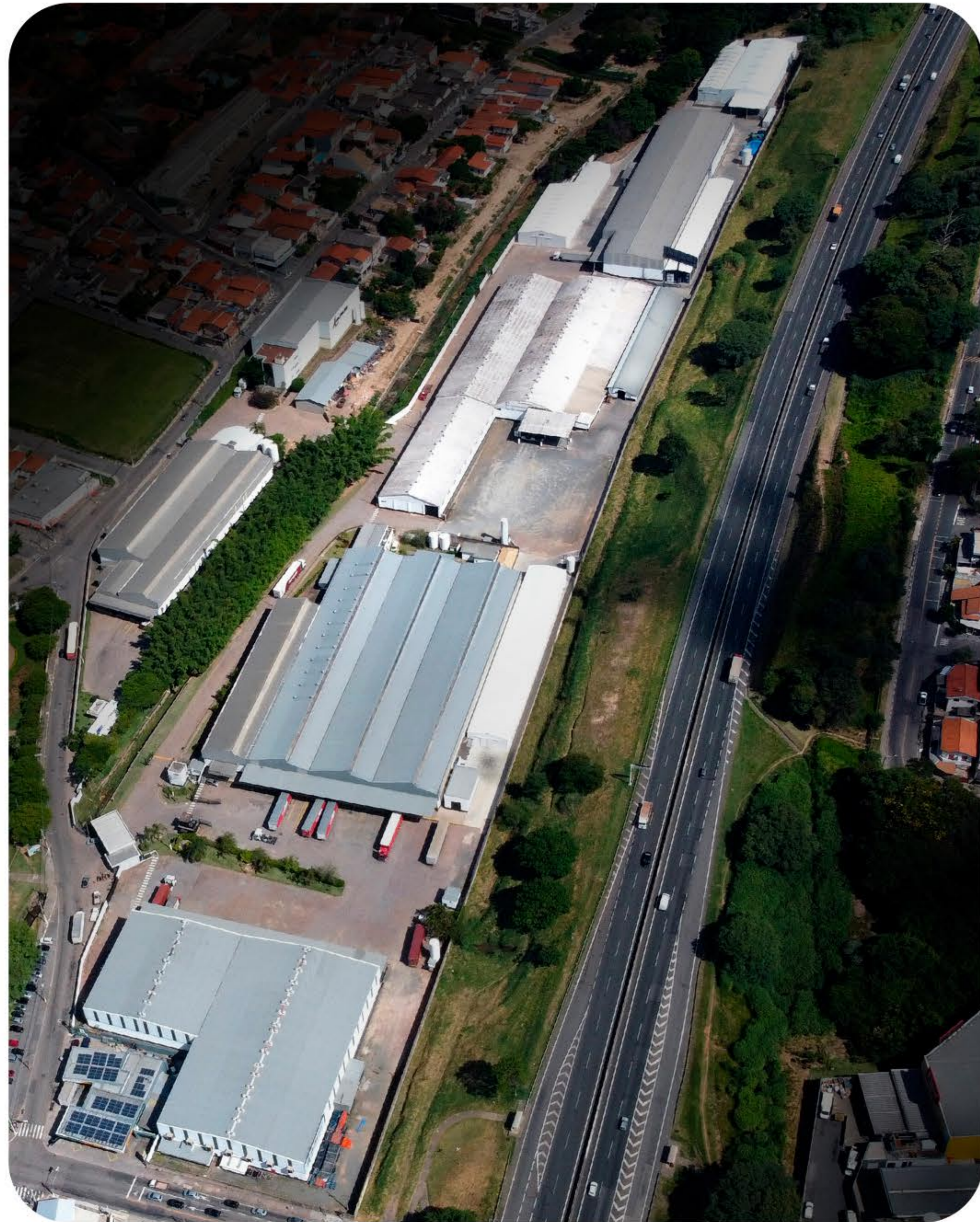
Vista aérea - Alfalog