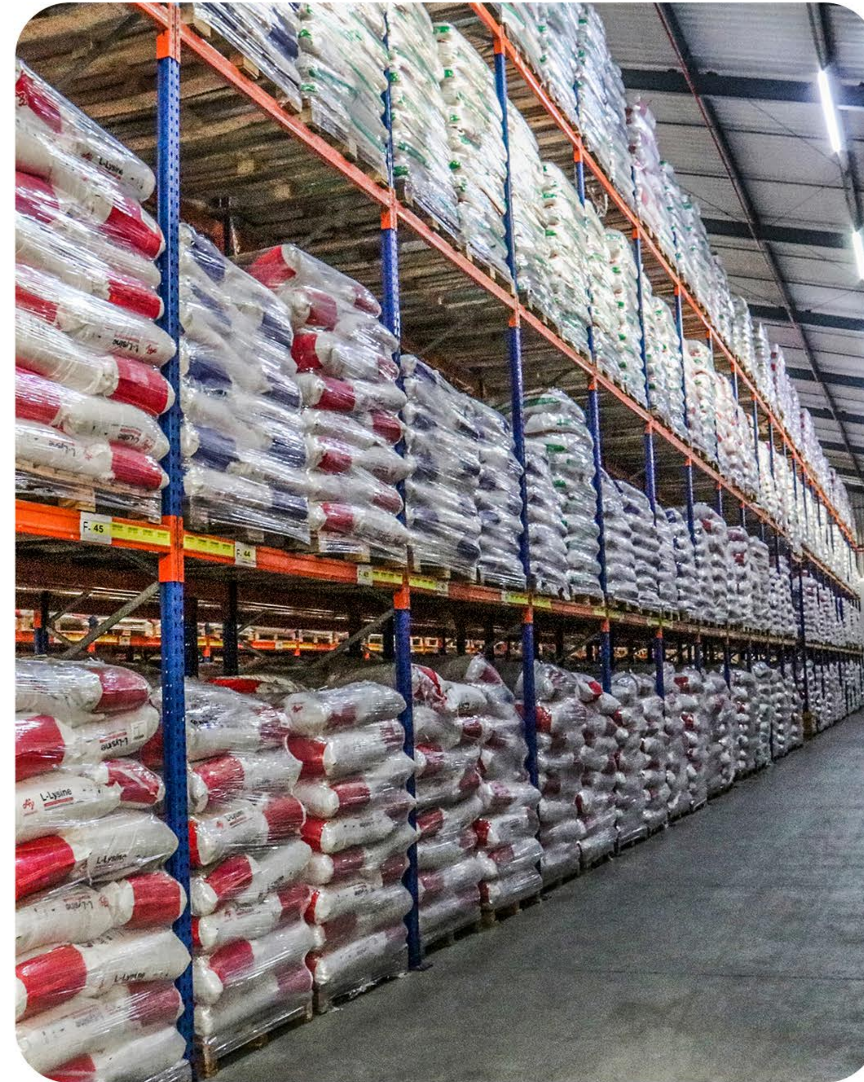
Armazém - Carga Seca